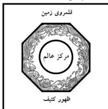
نمودار پردیس‌های آسمانی به مثابه مرکز عالم. ۳۷

به عنوان میانجی آسمان و زمین، زبدگانی دیگر بار به آن مرکز رجوع می‌کنند و از آنجا واسطه اعمال تأثیرات آسمانی بر زمین می‌شوند.