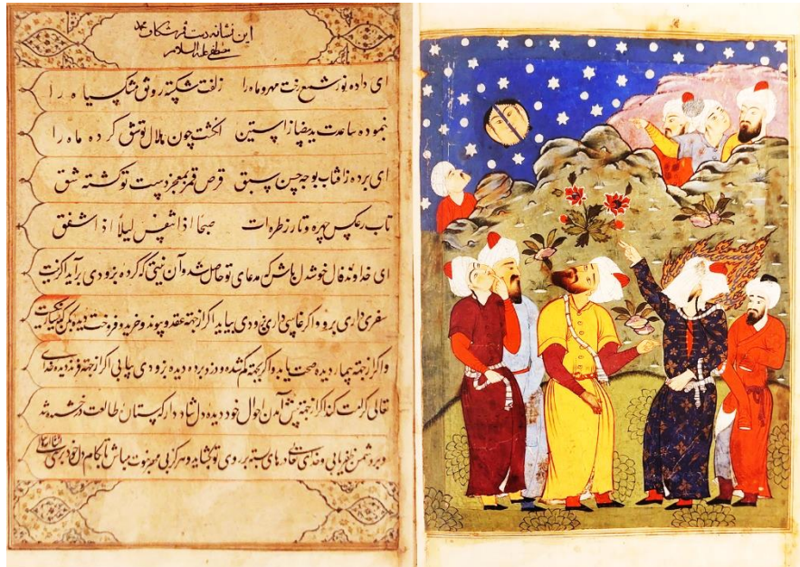
تصویر ۱ - نگاره شق القمر و برگه فالنامه آن، شاهنامه تهماسبی (۹۸۴ ه.ق) اندازه هر برگ ۴۱.۵ x ۵۵.۲ (پورا کبر، ۱۳۹۶: ۷۷-۷۶)