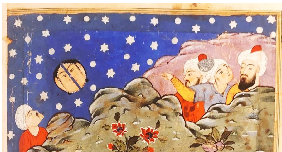
تصویر ۴- بخشی از نگاره شق القمر، شمار ۴۰ (۲۰ ستارگان و ۲۰ روشن‌ان آسمانی) شاهنامه تهماسبی (۹۸۴.ه.ق)، (پوراکیبر، ۱۳۹۶: ۷۶)